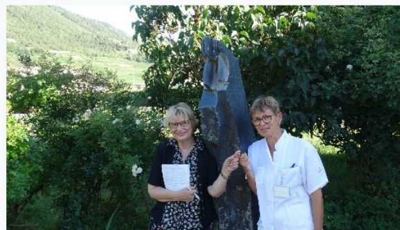
L'auteure et la narratrice.

Dans leurs témoignages, elles parlent de leur engagement et des défis que posent des situations singulières rencontrées dans leur pratique quotidienne, de leur rapport avec les parents, les familles et les patients. « J'avais déjà terminé ce livre avant la pandémie. Mon éditeur m'avait parlé de ce projet en 2018 déjà et m'avait demandé si j'étais intéressée, car une infirmière l'avait contacté. Elle désirait raconter les expériences vécues dans son milieu professionnel. Ce projet de livre m'a tout de suite séduite », poursuit-elle.